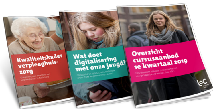
Een voorbeeld van brochures nieuwe stijl, met herkenbare uitstraling en doelgroep.

Het aantal mensen dat bijdraagt in het netwerk is de afgelopen jaren enorm gegroeid, net als de activiteiten die zij ondernemen en organiseren. Naar de publicaties die we met experts in ons netwerk ontwikkelen rondom bepaalde onderwerpen is veel vraag. We zien dat mensen gemiddeld zo'n vier gesprekken en blogs/vlogs per week starten op ons